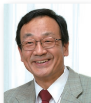
東京大学大学院 総合文化研究科教授 / 東京大学スポーツ先端科学研究拠点・拠点長

一層進む高齢者の急増に対応し、スポーツを通じた健康寿命延伸が重要な課題となっていますが、スポーツ・レクリエーション指導者の担うアウトリーチ型のスポーツ未実施者の参加促進と、楽しさと運動効果をベースとした継続へと促す動機付けの支援技術は、いままでにない新たな取組みとも言え、その成果が期待されるところで。