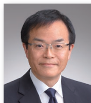
立教大学副総長/コミュニティ福祉学部 教授